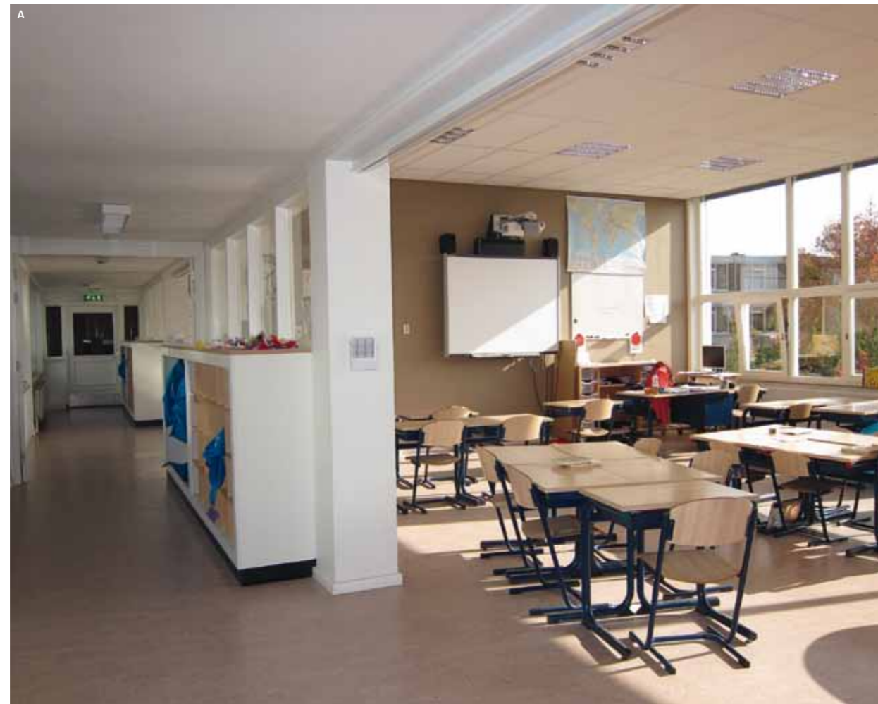
A Werkzone bovenbouw

Bij de midden- en bovenbouw op de eerste verdieping is het centrale lokaal getransformeerd tot mediatheek met een instructieruimte. Zo is die hele verdieping te beschouwen als een leerplein met verschillende zones. Rustig gesitueerd bij